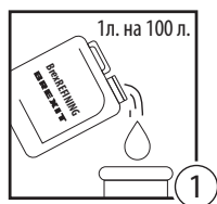
Шаг 1 - Подготовка новых систем

5.5 Добавить в систему VrexREFINING 603 из расчета 1 л на 100 л теплоносителя.